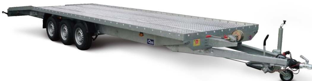
Indianapolis mit 3 Achsen