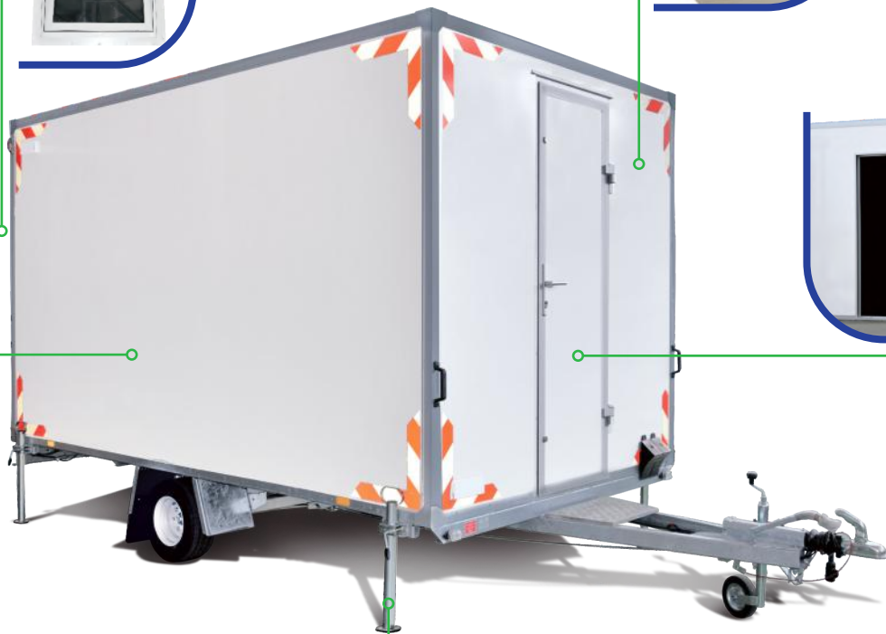
verzinkte Ausdrehstützen mit Kurbel