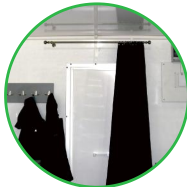
Gardinenstange mit Vorhang Garderobe mit 4 x Doppel-Garderobenhaken (Comfort- und Premium-Version)