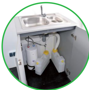
Waschbecken aus Edelstahl mit Wasserhahn, Kalt- und Warmwasserversorgung, Pumpe, Waschset, Frisch- und Abwasserbehälter, 5 l Boiler (Premium-Version)