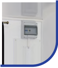
230V Elektroanschluss mit 2 Doppelsteckdosen