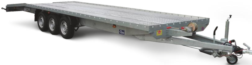
Indianapolis mit 3 Achsen